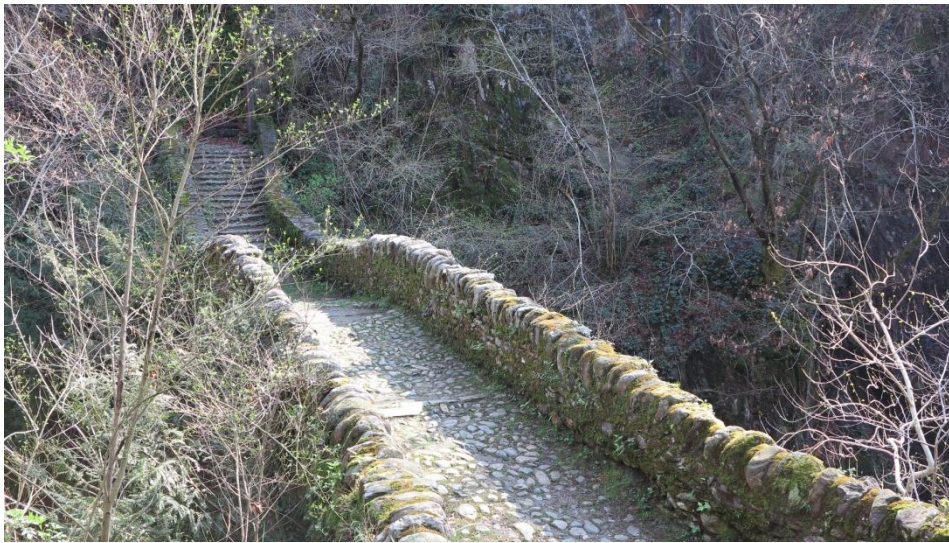
Fig. 1. Il Ponte "romano" di Cossogno nel Parco Nazionale della Val Grande.

ONLUS iscritta al Registro delle Associazioni di Volontariato della Regione Piemonte D.D. 34/11-11-1997 Fondata il 25-11-1976 - Aderente alla Pro Natura Piemonte e alla Federazione Nazionale Pro Natura Codice Fiscale 00439000035 – URL: http://www.pronaturanovara.it/ - e-mail: novara@pro-natura.it Segreteria: via Monte San Gabriele 19/c - 28100 NOVARA (aperta i mercoledì feriali dalle ore 16 alle ore 18, tranne agosto) - Tel. 0321 461 342 - Cell. 331 660 55 87 (sempre attivi).