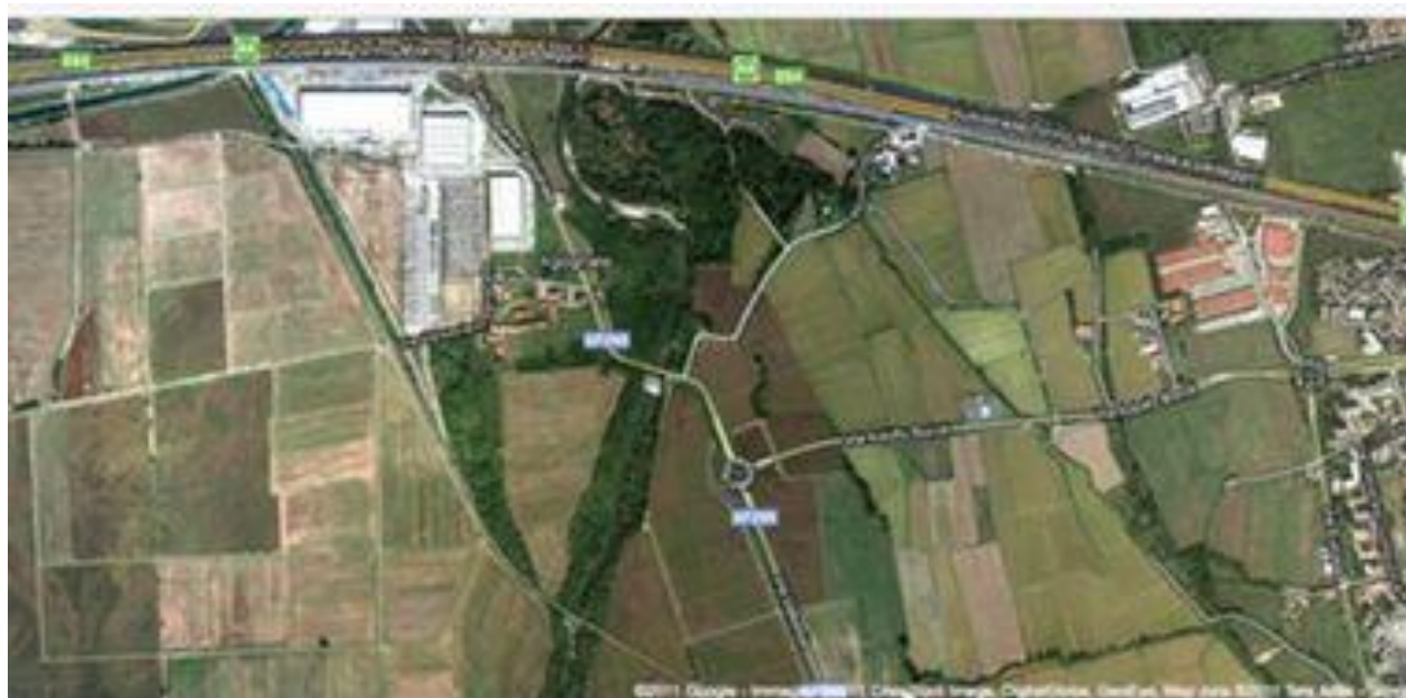
Fig. 6. Veduta satellitare del bosco di Agognate: http://pronaturanovara.it/woods/?id=14 .

Al termine della visita si esibirà il coro Gocce di musica diretto dal M° Massimo Focchi a cui farà seguito un piccolo rinfresco.