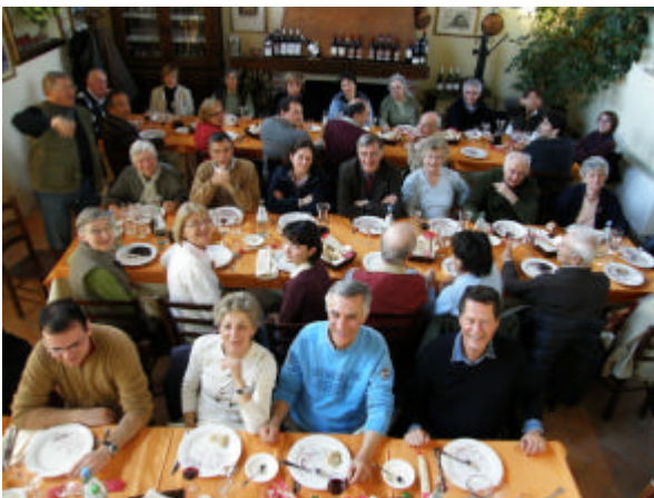
Pranzo a Casalbeltrame