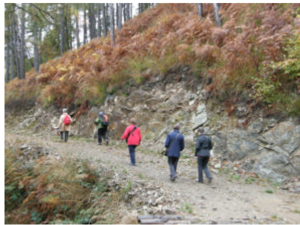
Escursione in Valgrande